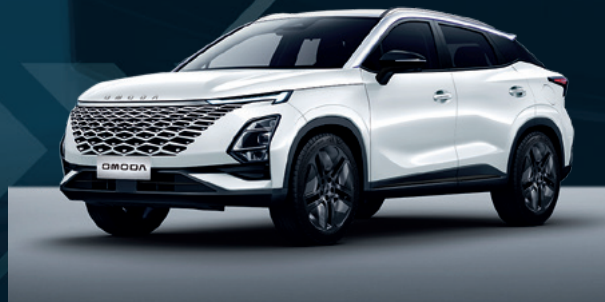
Khaki White Dla wersji Comfort