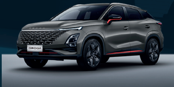
Phantom Gray z czerwonymi akcentami Dla wersji Premium