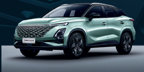
Aqua Green z czerwonymi akcentami i białym dachem Dla wersji Premium

Czerwone elementy znajdują się na podstawach lusterek bocznych, dolnej kracie wlotu powietrza oraz na listwach bocznych drzwi