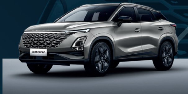
Aviation Silver Dla wersji Comfort

I co najważniejsze, niezależnie jaki kolor wybierzesz, nie dopłacasz za niego.