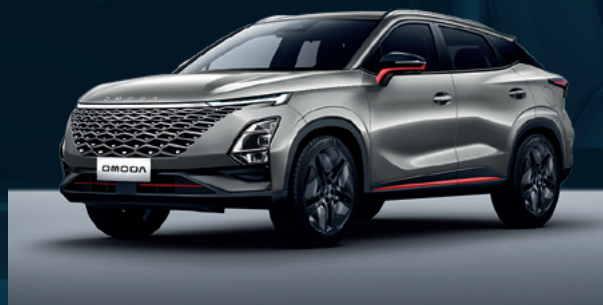
Aviation Silver z czerwonymi akcentami Dla wersji Premium