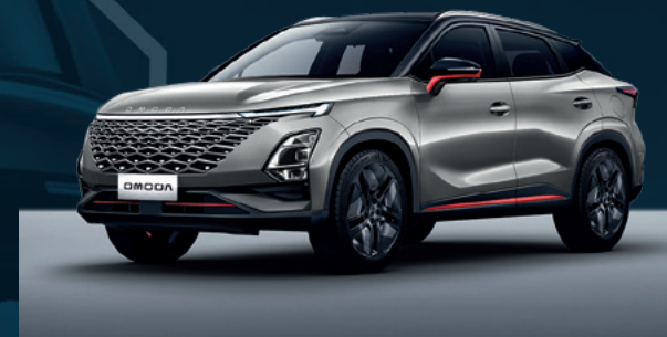
Aviation Silver z czerwonymi akcentami i czarny dachem Dla wersji Premium