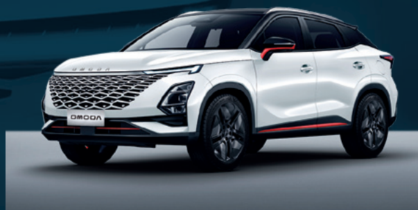
Khaki White z czerwonymi akcentami i czarnym dachem Dla wersji Premium