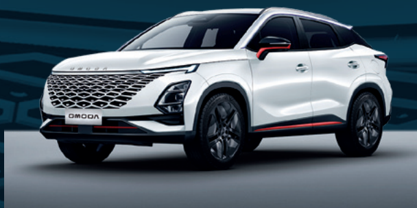
Khaki White z czerwonymi akcentami Dla wersji Premium