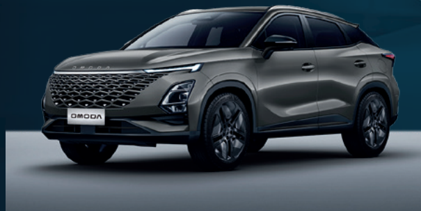
Phantom Gray Dla wersji Comfort